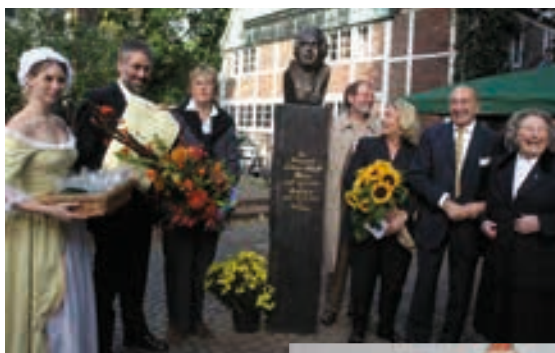
Enthüllung der Hasse-Büste im Jahr 2005

Die Bergedorfer Musiktage sind inzwischen ein etabliertes Musikfestival in Hamburgs Südosten und als Veranstalter hochwertiger klassischer Konzerte in unserer Region sehr geschätzt. In den Jahren der Vereinsgeschichte erfüllten wir die Aufgabe, aufstrebenden jungen Künstlern ein Podium zu bieten, sie zu fördern, sowie Schüler und Jugendliche an die klassische Musik behutsam heranzuführen.